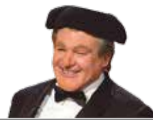
MIKE MYERS o smrti glumca Vernea Troyera

“Verne je bio besprijekoran profesionalac i svjetionik pozitivne za sve nas koji smo imali čast s njime raditi”