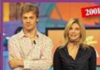
Ha esordito in tv con la seconda edizione del "Grande Fratello".