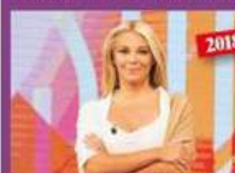
"Storie Italiane", su Raiuno, è stata la sua consacrazione.