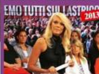
Ha condotto "Storie Vere" su Raiuno all'interno di "UnoMattina".